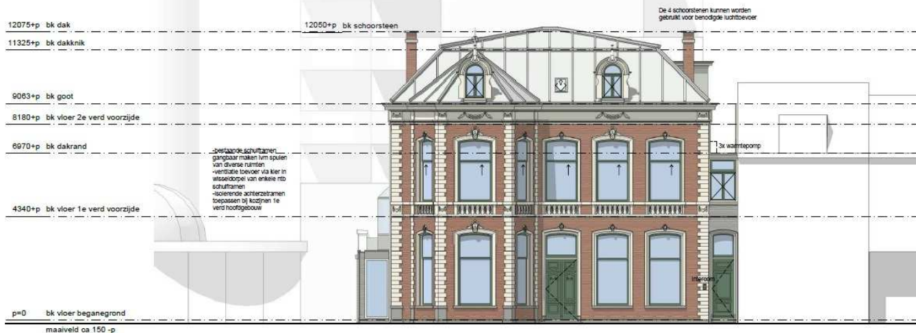
Voorgevel - nieuw